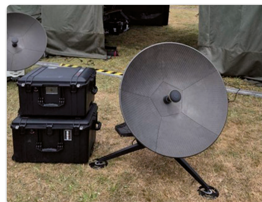
SCARAB von Holkirk, Multi-band multi-orbit motorisiertes Manpack Terminal

Im Rahmen von SeRANIS wurde eine multi-orbit-fähige Full-Motion-Bodenstationsantenne des Herstellers Kratos Antenna Solutions realisiert und in die bestehende Infrastruktur der Universität der Bundeswehr München integriert. Die Systemintegration wurde durch Milexia Deutschland als Added-Value Distributor begleitet. Sie umfasst neben der mechanischen Installation insbesondere die Einbindung in die bestehende Hochfrequenz (HF)- und Steuerungsarchitektur der Bodenstation.