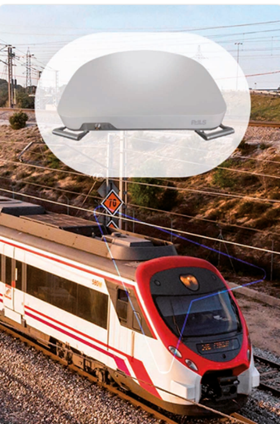
Phased-Array-Antennen von Pals