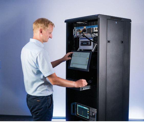
Bild 1: TSEP entwickelt komplexe Test- und Messsysteme unter anderem für den Automotive-Bereich.

Auf der Messgeräte-Seite ist zudem das in der USBTMC-Spezifikation beschriebene USBTMC-Protokoll zu implementieren. Somit enthält die Messgeräte-Seite auch einen Software-Anteil, der zu implementieren, zu testen und zu warten ist.