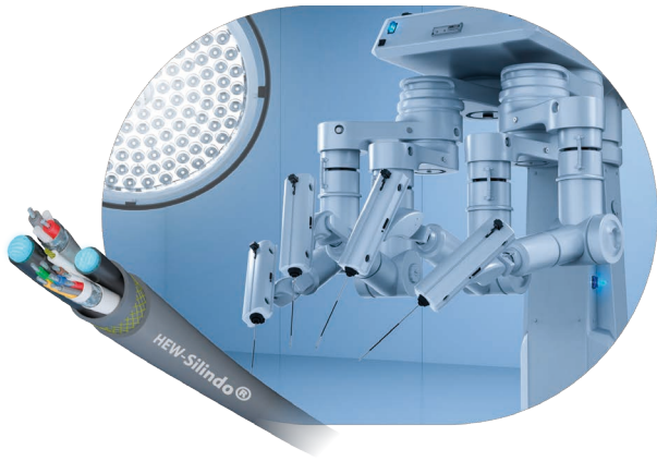
OP-Roboter und Silindo Kabel, alle Bilder © Hew-Kabel, außer sie sind anders gekennzeichnet

Der unterschätzte Engpass: Wenn Sterilisation zur Systemschwachstelle wird