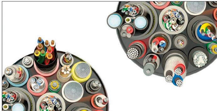
Kabel aus unterschiedlichen Materialien mit unterschiedlichen Kabelquerschnitten