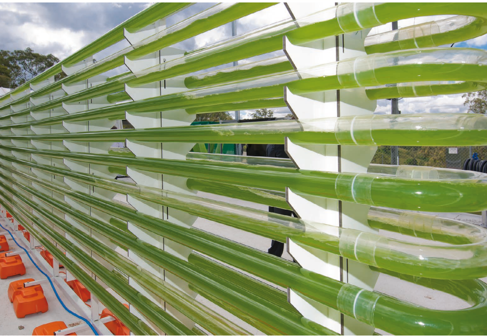
Bild 4: Die New-Food-Branche erschließt alternative Nahrungsquellen, die in der Herstellung deutlich weniger Ressourcen verbrauchen als bisherige.

erschließt alternative Nahrungsquellen, die in der Herstellung deutlich weniger Ressourcen verbrauchen als bisherige. Hier mit passenden Komponenten oder Prozess-Know-how zu unterstützen, leistet ebenfalls einen relevanten Beitrag zu regenerativem Wirtschaften. Beispielsweise ist die Gewinnung von Algen als alternative proteinreiche Nährstoffquelle ein interessanter Ansatz im Zusammenhang von regenerativem Wirtschaften. In einer globalen Partnerschaft engagiert sich Bürkert an entsprechenden Projekten der University of Queensland (Bild 4). Ein weiteres Beispiel findet sich bei Bioreaktoren zur Kultivierung von Proteinen als nachhaltige Alternative zur herkömmlichen Fleischproduktion. Hier braucht es perfekt funktionierende Regelkreise, damit Prozesse effizient und sicher ablaufen. Bürkert unterstützt dazu Unternehmen wie DDE in Indien, die für ein kalifornisches Start-up Seeding-Bioreaktoren und Produktionsanlagen entwickelt haben.