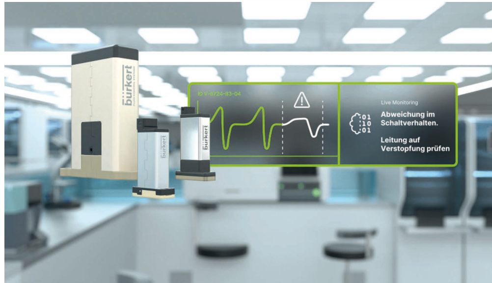
Bild 2: ValveInsight von Bürkert ist ein Algorithmus für die Magnetventilserie Whisper Valve, der Ventile direkt beim Schalten überwacht, ohne zusätzliche Sensorik zu benötigen.

Regeneratives Wirtschaften beginnt im Detail bei den eingesetzten Komponenten, ist aber nicht nur eine Frage der Komponenten. Auch ein systemischer Blick auf die jeweilige Applikation eröffnet Möglichkeiten. So kann eine clevere Komponente entlang der gesamten Wertschöpfungskette einschließlich des Prozesses