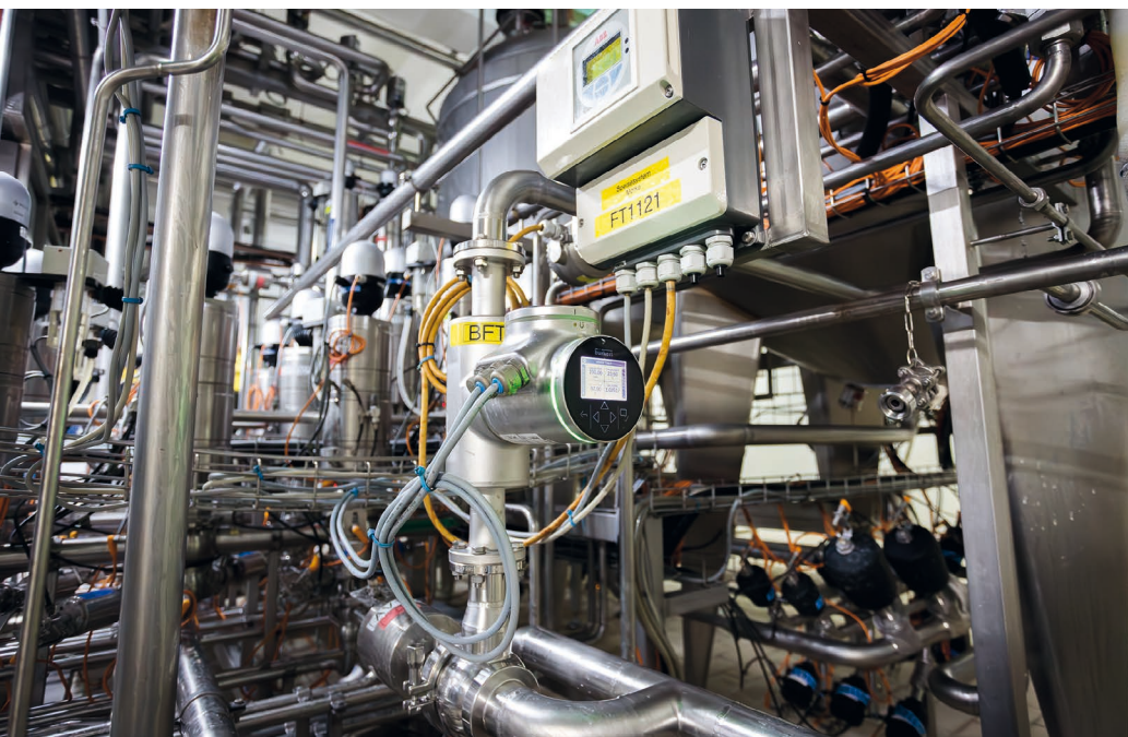
Bild 3: Der Durchflussmesser FLOWave unterscheidet innerhalb von Millisekunden zwischen Produkt, Reinigungsmedium und Mischphasen. So lassen sich beim Medienwechsel große Mengen Ausschuss einsparen.

Neben den bestehenden Anwendungen gibt es auch zahlreiche Einsatzfelder und Branchen, denen regeneratives Wirtschaften fast schon inhärent ist. Die New-Food-Branche beispielsweise