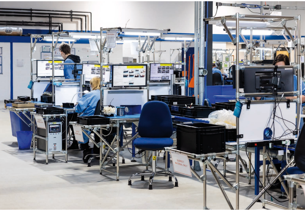
Produktionshalle der Alexander Battery Technologies

Wenn ein Roboter stehen bleibt, kommt in der Regel auch alles um ihn herum zum Stillstand. Der Akkupack ist selten das erste Bauteil, an das man denkt – doch er ist oft der entscheidende Faktor dafür, ob die Maschine wie vorgesehen arbeitet. Wird er entsprechend dem tatsächlichen Einsatzprofil entwickelt und richtig getestet, verrichtet er seine Arbeit unauffällig im Hintergrund und hält den Betrieb zuverlässig am Laufen. Wenn nicht, treten Probleme schnell auf: verkürzte Laufzeiten, Wärmeentwicklung oder vorzeitige Alterung, die den Betrieb vollständig zum Erliegen bringen können. Gleichbleibende Leistung und zuverlässiger Betrieb sind das Ergebnis früh getroffener Entwicklungsentscheidungen – basierend darauf, wie der Roboter im Alltag tatsächlich genutzt wird.