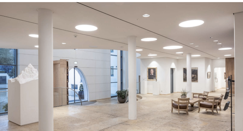
Sanieren statt ersetzen: Mit gezielter LED-Umrüstung wurden bestehende Leuchten technisch auf den neuesten Stand gebracht – ressourcenschonend, wirtschaftlich und ohne bauliche Eingriffe.

Die größte Herausforderung bestand in der Integration der LED-Technologie in bestehende, trimless-verbaute Gehäuse. Ein kompletter Austausch wäre mit großem baulichem Aufwand verbunden gewesen. Stattdessen wurde ein Konzept realisiert, bei dem die ursprünglichen Gehäuse der Leuchten in der Decke verbleiben konnten und neue LED-Module präzise eingebaut wurden. Danach konnte die gereinigte Originalabdeckungen problemlos wieder eingesetzt werden.