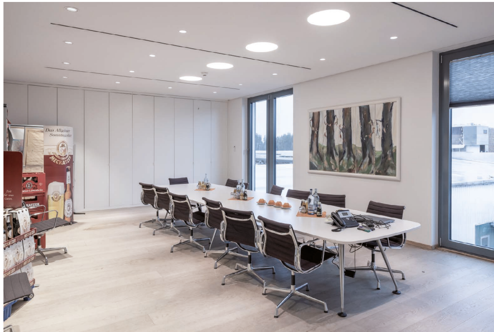
Die ILVY-Downlights im Besprechungsraum liefern neutralweißes, gleichmäßiges Licht für konzentriertes Arbeiten – mit hoher Farbwiedergabe und minimalem Wartungsaufwand.

Diese Vorgehensweise ermöglichte eine schnelle, saubere und effiziente Umrüstung ohne Betriebsunterbrechung. Keine Demontage, kein Staub, kein Lärm und keine baulichen Eingriffe – sondern werkzeugarme, geräuscharme Installation im laufenden Geschäftsbetrieb ohne nachträgliche Handwerker- oder Malerarbeiten. Für Elektroinstallateure bedeutet das eine verlässliche Lösung mit hoher Praxistauglichkeit.