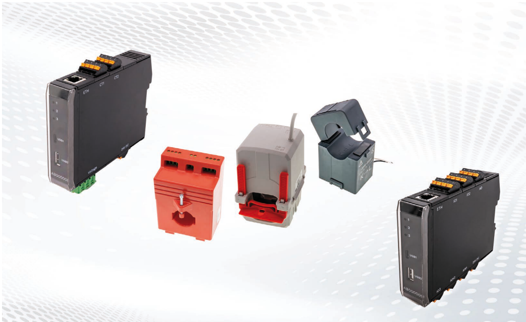
Das Energiemessmodul (links) erfasst in Kombination mit Stromwandlern (Mitte: hier für die Montage auf einer Stromschiene oder an Rundleitern) den Stromverbrauch von Anlagen. Rechts ein optional einsetzbares I/O-Modul, mit dem die Anzahl an Schnittstellen des Gateways maßgeblich erweitert werden können.

Aufgrund des flexiblen, modularen Einsatzkonzepts eignet sich das Gateway überdies ideal zur Modernisierung von Altanlagen im Zuge von Retrofits.