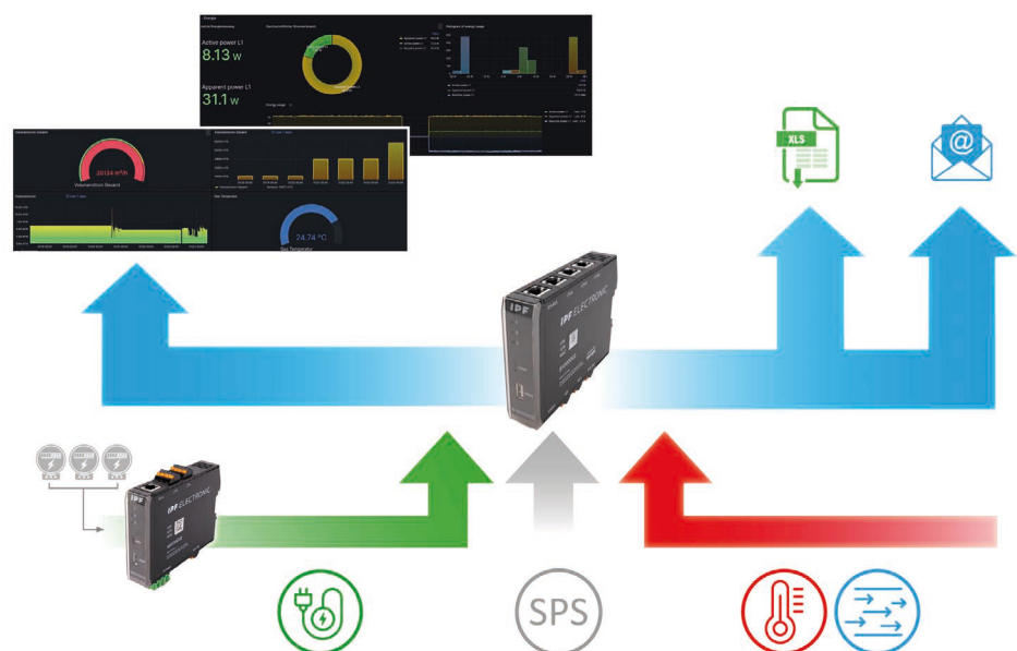
Energiemonitoring inklusive Gasverbrauchsmessung: Das Energiemessmodul (links unten) ist an das Gateway (Mitte) angeschlossen, das ebenfalls mit der SPS der Maschine gekoppelt ist. Der Durchflusssensor mit Analogausgang (rechts schematisch dargestellt) liefert die Daten zum Gasverbrauch und zur Gastemperatur.

Mit diesem einfach aufgebauten System kann der Betrieb die beschriebenen Ziele mit wenig Aufwand erreichen, um u. a. anhand der Datenanalyse Potenziale für Energieeinsparungen im Sinne eines Energiemanagements gemäß ISO-50001 zu heben. Überdies erhöht sich die Prozesssicherheit aufgrund der in Echtzeit aufgezeichneten Messwerte. Die Visualisierungssoftware ermöglicht z. B. den Export der