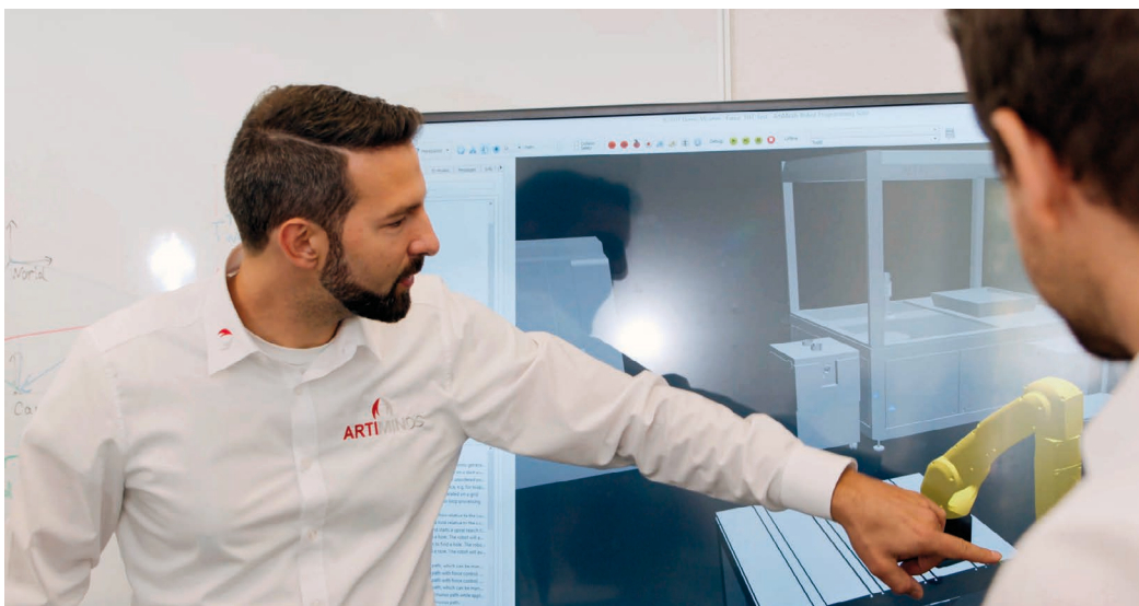
Bild 5: Die Vorarbeit und technische Evaluation durch externe Robotikexperten im Rahmen der Konzeptentwicklung, dem Proof of Concept und Prototyping spart Zeit und stellt sicher, dass eine Umsetzung tatsächlich möglich, bevor man z. B. direkt mit dem Anlagenbau beginnt.

ArtiMinds Robotics entwickelt Softwarelösungen, um die Arbeitsabläufe bei der Integration und dem Einsatz von Industrierobotern zu standardisieren und kontinuierlich zu optimieren. Ziel ist es, das Programmieren und Bedienen von Industrierobotern zu vereinfachen und eine kosteneffiziente Integration und Instandhaltung sowie flexible Automatisierung zu ermöglichen. ◀