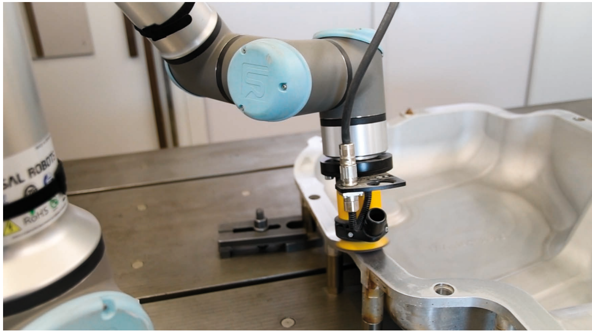
Bild 4: Von hoch-diffizilen Fertigungsprozessen bis hin zu feinfühligem Arbeitsschritten – die Roboter-Automatisierung wird künftig noch mehr Möglichkeiten bieten

Der Erfolg eines roboterbasierter Automatisierungsprojekts hängt nicht nur von einer optimalen technischen Umsetzung, sondern viel-