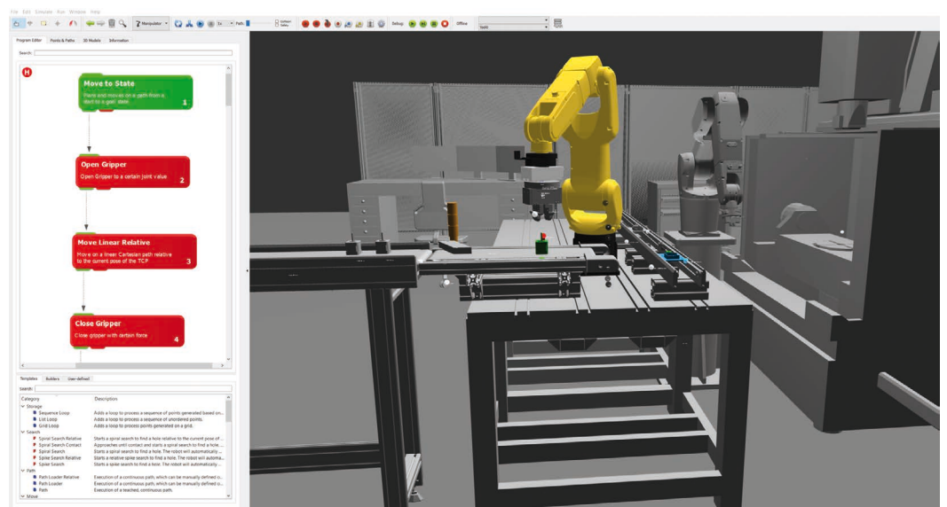
Bild 3: Moderne Softwarelösungen bieten eine grafische Programmieroberfläche, über die sich mit Funktionsbausteinen auch komplexe, sensoradaptive Bewegungsabläufe und -bahnen programmieren und parametrieren lassen

Auch das Automatisieren von Nebenprozessen kann zur Hürde werden, z. B., wenn Material nicht vereinzelt zuführbar oder die Materialabfuhr zum nächsten Prozessschritt anspruchsvoll ist. Auch bei komplexen Fertigungsprozessen mit vielen Arbeitsschritten stoßen Planer oft an Grenzen, da die Vielfältigkeit und Vielschichtigkeit der Aufgaben schwer von Maschinen oder Robotern beherrscht werden kann. Rein kognitiv scheint der Mensch in Summe hier im Vorteil. Doch sobald Prozesse und die Einhaltung von Vorgaben nachweisbar dokumentiert werden müssen, fehlt die digitale Grundlage, die Roboter oder Maschinen liefern können. Gleiches gilt hinsichtlich der Reproduzierbarkeit.