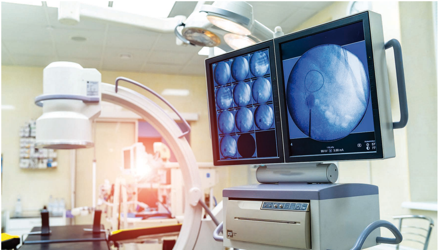
Bild 3: OLEDs sind in der Medizintechnik unverzichtbar, dank ihrer herausragenden Darstellungseigenschaften in Diagnosegeräten. Das detailreiche Bild mit hohen Kontrasten ermöglicht präzise Diagnosen.