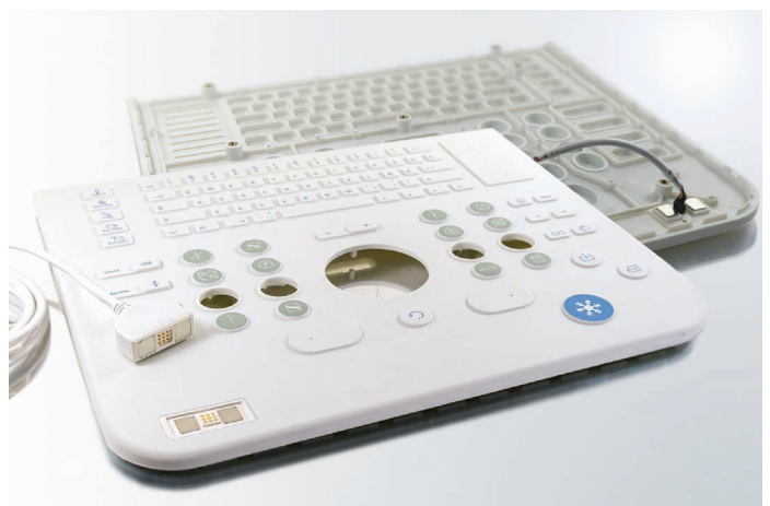
Bild 6: Der Mehrkomponentenspritzguss ermöglicht eine nahtlose Integration von zusätzlichen Funktionselementen

Seit über 20 Jahren entwickelt und fertigt die N&H Technology GmbH kundenspezifische Baugruppen und Komponenten für die unterschiedlichsten Branchen und Anwendungen. Mit dem anfänglichen Schwerpunkt auf elektromechanischen Eingabeeinheiten, liefert das mittelständische Unternehmen mittlerweile alle Komponenten für HMI Bedieneinheiten und bietet den entsprechenden technischen Support an. ◀