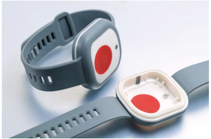
Bild 5: Aufgepripitztes Tastenlayout für geschlossene Oberflächen

differenziertes haptisches Feedback, welches die Benutzererfahrung signifikant steigert. Darüber hinaus bieten spezielle Oberflächenbeschichtungen wie Polyurethan (PU) oder Epoxydharz einen dauerhaften Schutz gegen mechanischen Abrieb. Auch die Integration moderner Beleuchtungstechnologien wie Status-LEDs oder Hinterleuchtung in Kombination mit transparenten Elastomeren ist problemlos möglich.