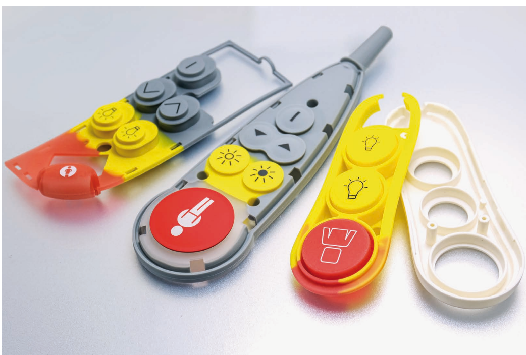
Bild 3: Silikonschaltmatten werden in die Gehäuse integriert und passen sich perfekt an.

Ein weiterer entscheidender Vorteil von Silikonschaltmatten besteht in ihrer außerordentlichen Designflexibilität und Anpassungsfähigkeit. Im Gegensatz zu Folientastaturen, die physische Limitierungen insbesondere in der räumlichen Ausdehnung der Tasten haben, bieten Silikonkontakte eine erhebliche Freiheit in der Gestaltung und ermöglichen Tasten mit einer Höhe von mehreren Zentimetern. Diese Flexibilität erstreckt sich über ein breites Spektrum von Anwendungsmöglichkeiten: von variablen Tastenformen und -größen bis hin zu individuellen Farboptionen und spezifischen Oberflächenstrukturen. Zusätzlich ermöglichen gezielte Erhebungen oder Vertiefungen in den Tasten ein