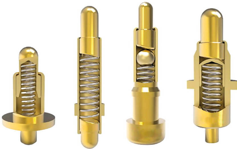
Bild 1: Design Varianten von Federkontakten: Back Drill Design, Bias Design, 4P Design mit Ball, 4P Design mit Cap

Die vielseitigen Einsatzmöglichkeiten von Federkontakten spiegeln sich in Anwendungen für sämtliche Branchen und Produkte wieder. Kein Wunder, denn die zunehmende Komplexität der heutigen Elektronik erhöht die Montagekosten erheblich. Daneben schreitet der Trend zu immer schmaleren und designorientierten Bauweisen von Kommunikationsgeräten weiter voran und macht die Integration von Standard-Steckverbindern schwierig. Hier punkten Federkontaktstifte mit ihren sehr kleinen Bauweisen und einer Reduzierung der manuellen