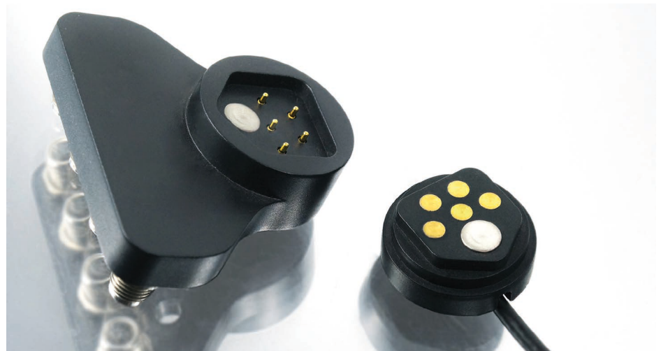
Bild 6: Magnetischer Stecker auf Federkontaktbasis, kundenspezifisch

Seit über 20 Jahren entwickelt und fertigt die N&H Technology GmbH kundenspezifische Baugruppen und Komponenten für die unterschiedlichsten Branchen und Anwendungen. Mit dem anfänglichen Schwerpunkt auf elektromechanischen Eingabeeinheiten, liefert das mittelständische Unternehmen mittlerweile alle Komponenten für HMI-Bedieneinheiten und bietet den entsprechenden technischen Support an. ◀