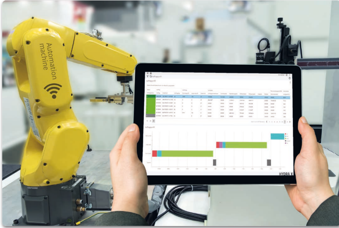
Manufacturing Execution Systeme wie HYDRA X von MPDV erweitern die technische Sicht auf die Produktion um organisatorische Zusammenhänge