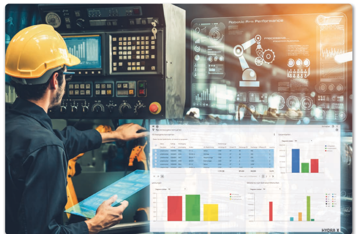
Neben den technischen Daten aus dem IIoT kennt ein MES wie HYDRA X auch Aufträge und Arbeitsgänge.

MPDV mit Hauptsitz in Mosbach ist der Marktführer für IT-Lösungen in der Fertigung. Mit mehr als 45 Jahren Projekterfahrung im Produktionsumfeld verfügt MPDV über umfangreiches Fachwissen und unterstützt Unternehmen jeder Größe auf ihrem Weg zur Smart Factory. Täglich nutzen weltweit mehr als 1.000.000 Menschen in über 1.500 Fertigungsunternehmen die innovativen Softwarelösungen von MPDV. Dazu zählen namhafte Unternehmen aller Branchen. ◀