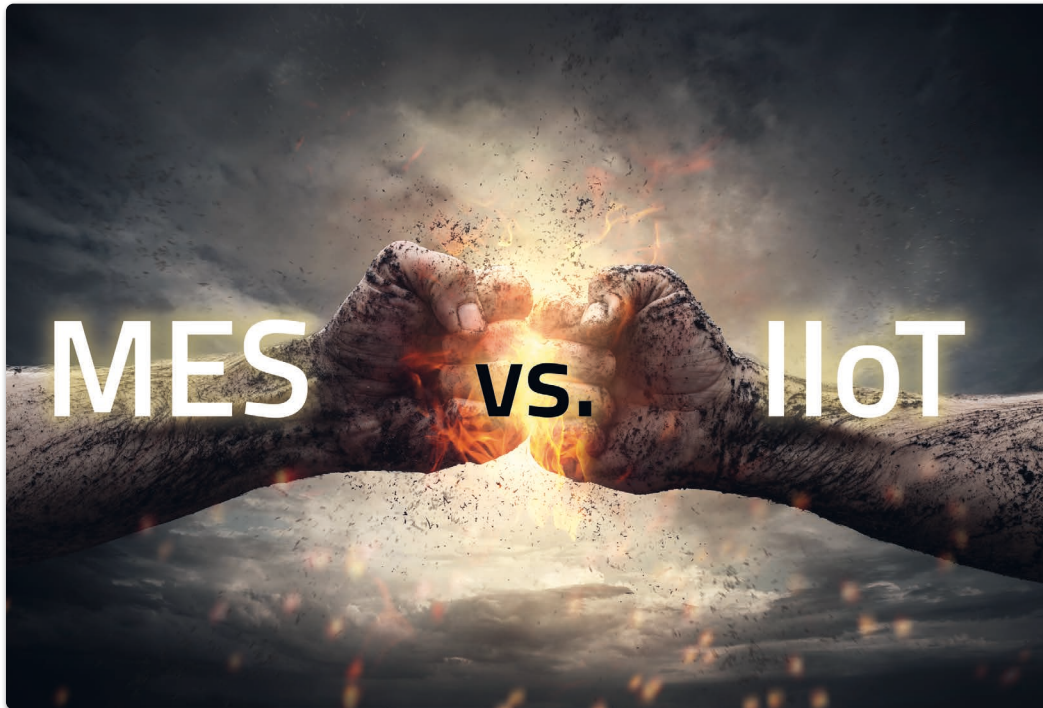
MES vs. IIoT