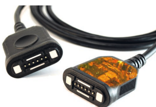
Bild 4: Diagnosekabel im Hotmelt Verfahren zum Schutz elektronischer Komponenten

Der Form und Farbe eines magnetischen Verbindungssystems sind nahezu keine Grenzen gesetzt. Individuelle Farbakzente und Designansprüche können durch entsprechende Werkzeuge problemlos umgesetzt werden. Dabei bedingen manchen Formen auch vorteilhafte Features. Zum Beispiel ermöglichen runde Stecker mit einem äußeren Magnetring 360° Drehungen bei konstanter Kontaktierung (Bild 3). Bei der Anwendung in einem Handschalter kann