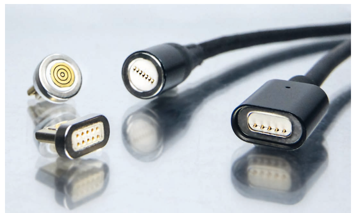
Bild 5: Magnetischer Adapter für Re-Design – kundenspezifische Entwicklung

Seit über 20 Jahren entwickelt und fertigt die N&H Technology GmbH kundenspezifische Baugruppen und Komponenten für die unterschiedlichsten Branchen und Anwendungen. Mit dem anfänglichen Schwerpunkt auf elektromechanischen Eingabeeinheiten, liefert das mittelständische Unternehmen mittlerweile alle Komponenten für HMI Bedieneinheiten und bietet den entsprechenden technischen Support an. ◀