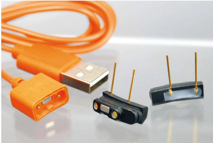
Bild 2: kundenspezifische Magnetlösung für eine runde Einbausituation

Wearables sehr interessant sind. Als Beispiel genannt sei die Super AP Beschichtung, welche extrem widerstandsfähig gegen elektrolytische bzw. galvanische Korrosion ist, während sie einen sehr geringen Widerstand beibehält. Im Vergleich zu einer Gold Beschichtung ist die Super AP Beschichtung zweimal widerstandsfähiger gegen Salzwasser, fünfmal resistenter gegen Transpiration und um Faktor 30 widerstandsfähiger gegen Elektrolyse. Die Korrosion der elektrischen Kontakte durch Schweiß oder Feuchtigkeit wird effektiv minimiert.