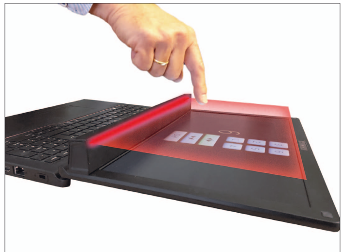
Bild 1: Infrarot-Touchscreen mit Abstand zum Display

Die berührungslose Gestensteuerung wertet eine Bewegung in Bezug zum Touchsensor aus. Das Messverfahren kann zweidimensional, wie beim Infrarottouchscreen sein. Bei der Auswertung des elektrischen Feldes vor einer Sensorfläche, ähnlich einem PCAP (projected capacitive touch screen) kommen Bewegungen in allen drei Dimensionen infrage. Berührungslos können mehr oder weniger qua-