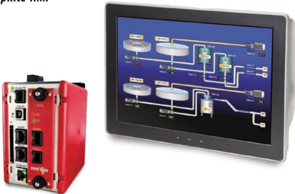
Red Lions Data Station Plus und Graphite HMI